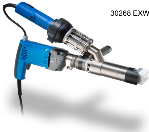
30268 EXWELD aero