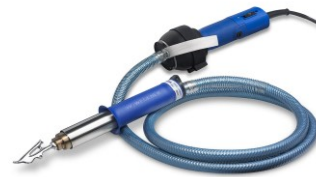
10818 Duratherm SC, 230V