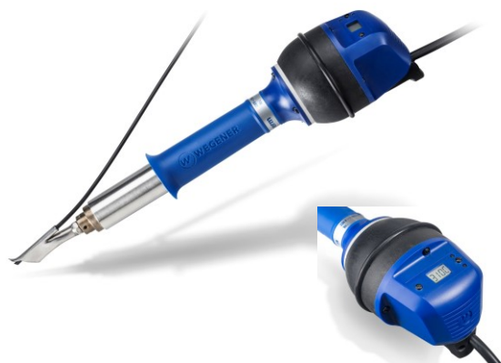
25555 Exotherm, 230 V 25556 Exotherm, 120 V

25555 Exotherm, 230 V, 25556 Exotherm, 120 V